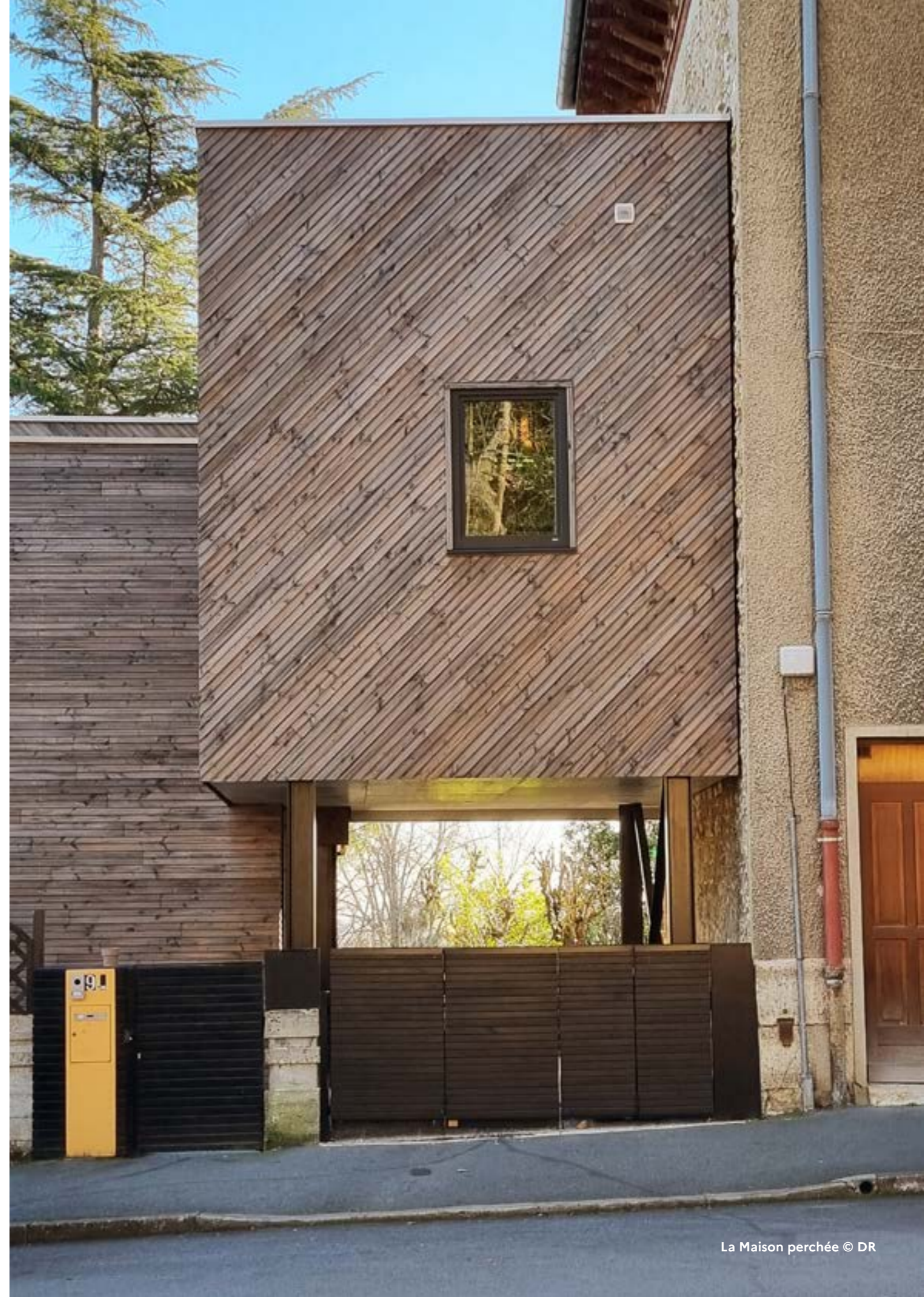
La Maison perchée