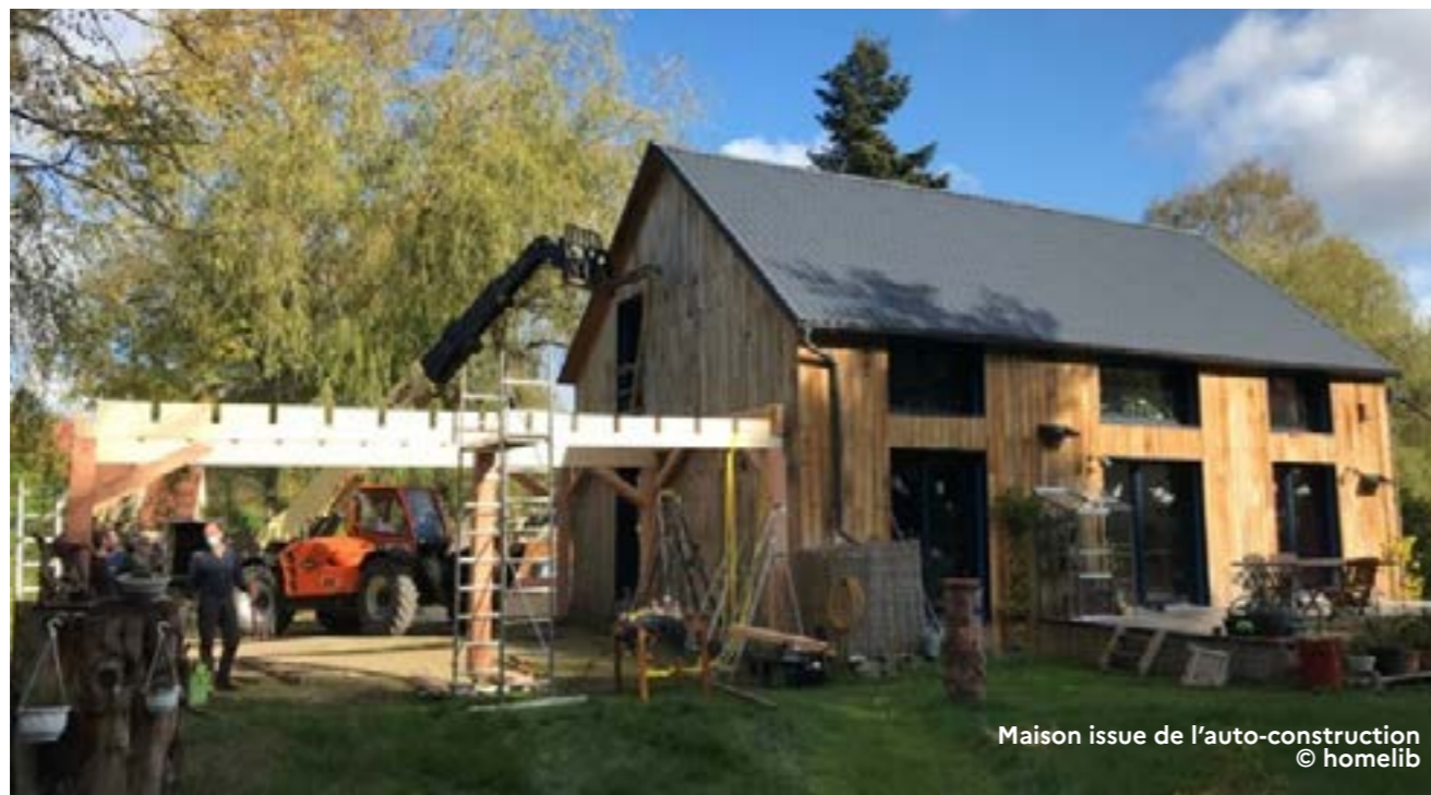
Maison issue de l'auto-construction

Déambulation théâtralisée dimanche de 20h à 21h (sur inscription).