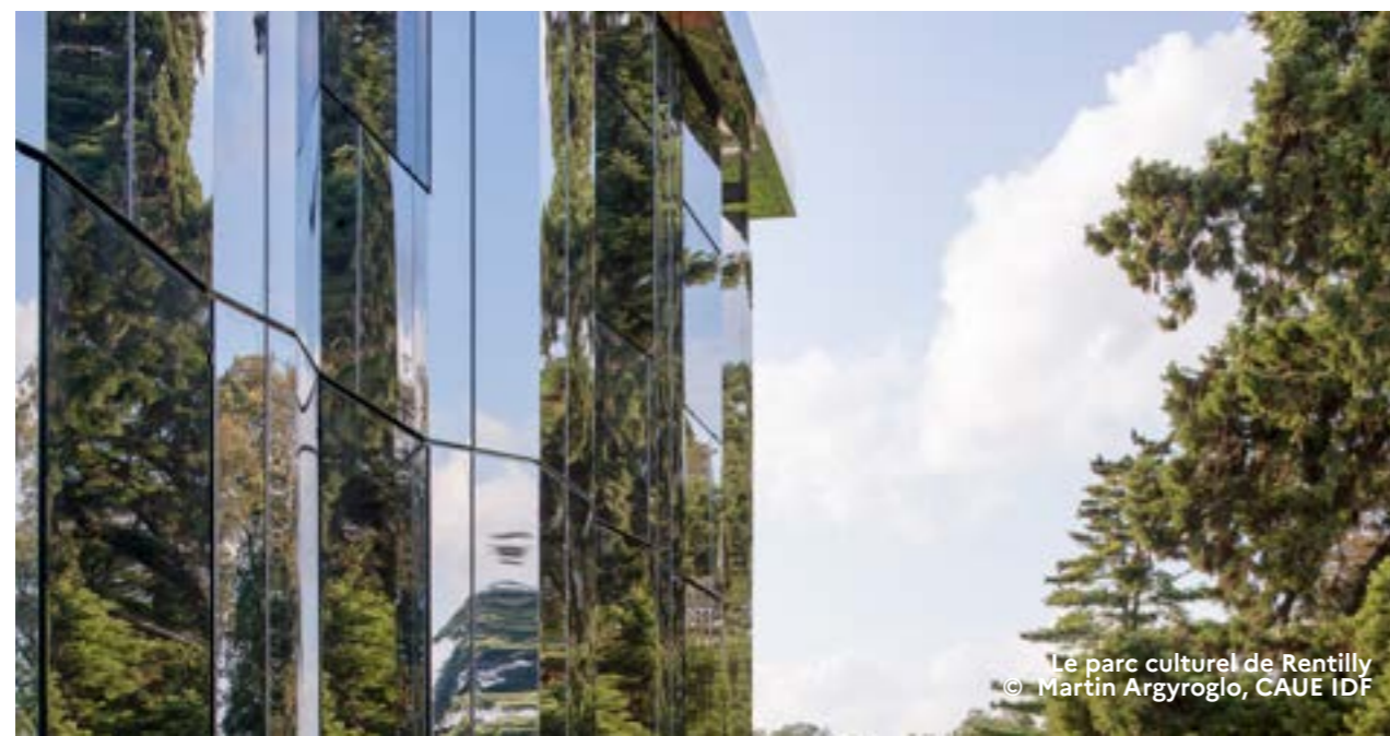
Le parc culturel de Rentilly

Informations et réservations : caue-idf.fr