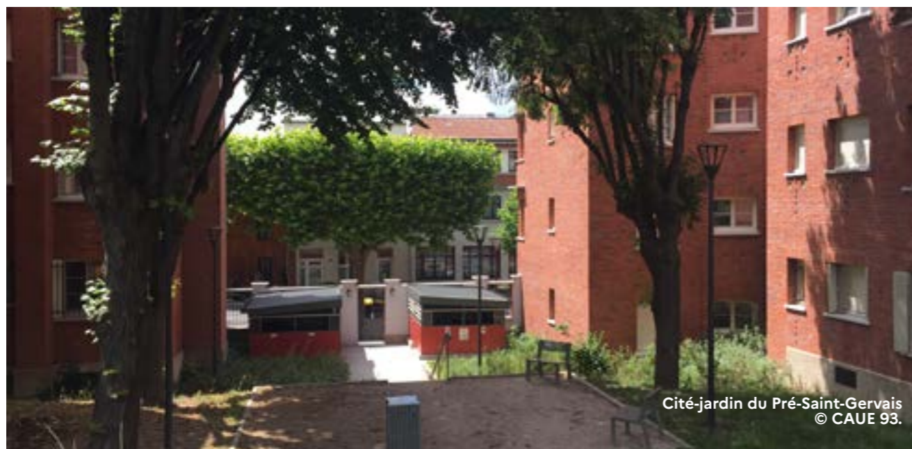
Cité-jardin du Pré-Saint-Gervais © CAUE 93.

Itinéraire guidé samedi de 14h30 à 16h30 (sur inscription).