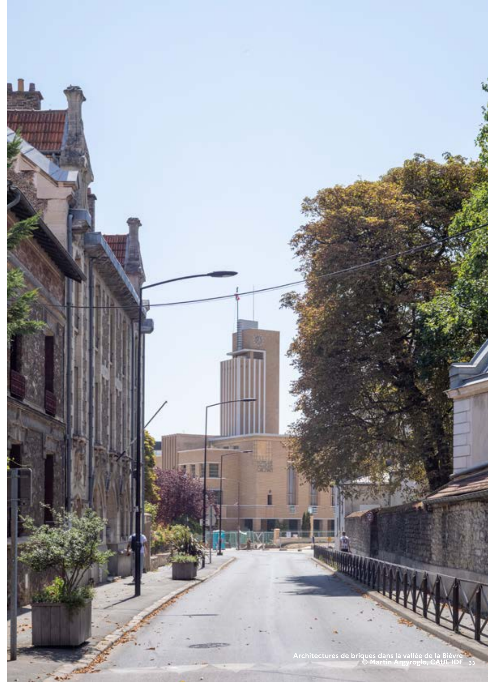
Architectures de briques dans la vallée de la Bièvre