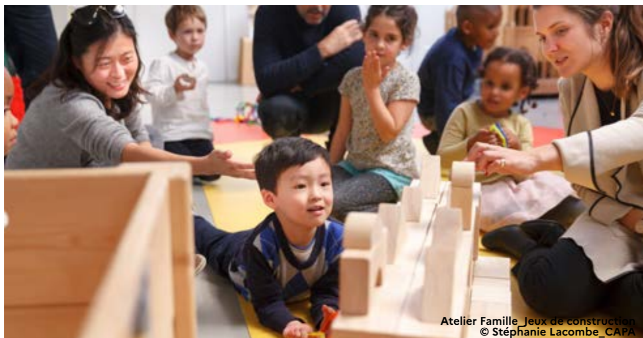
Atelier Famille Jeux de construction

Portes ouvertes, ateliers samedi de 10h à 17h (à partir de 3 ans).