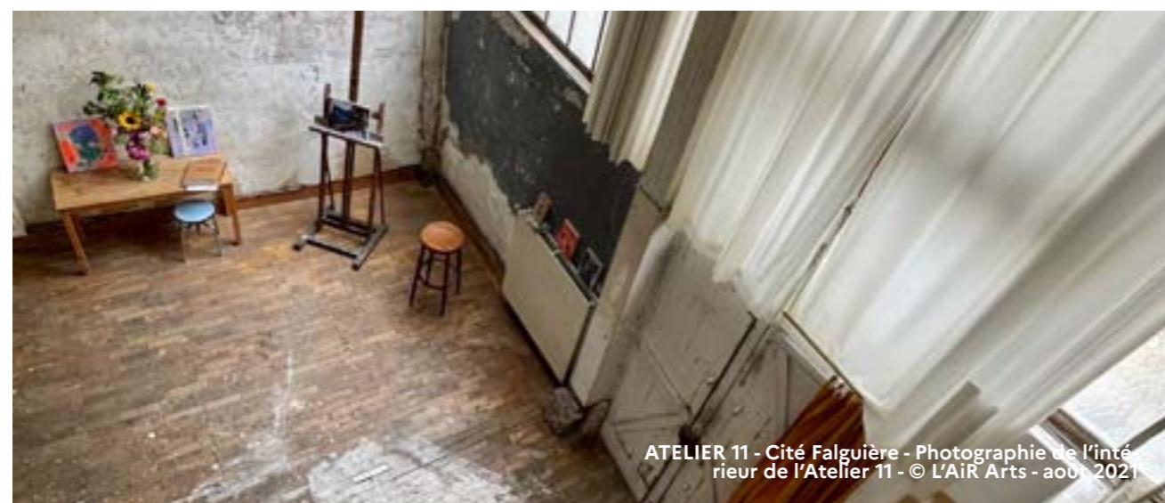
ATELIER 11 - Cité Falguière - Photographie de l'intérieur de l'Atelier 11 - août 2021

Portes ouvertes samedi et dimanche de 11h à 18h (sur inscription).