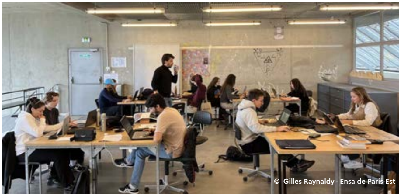
© Gilles Raynaldy - Ensa de Paris-Est

Plus d'informations sur journeesarchitecture.fr